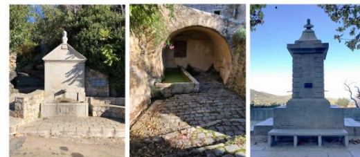
Fontaine de Zilia

Réduisons notre consommation de bouteilles en plastique